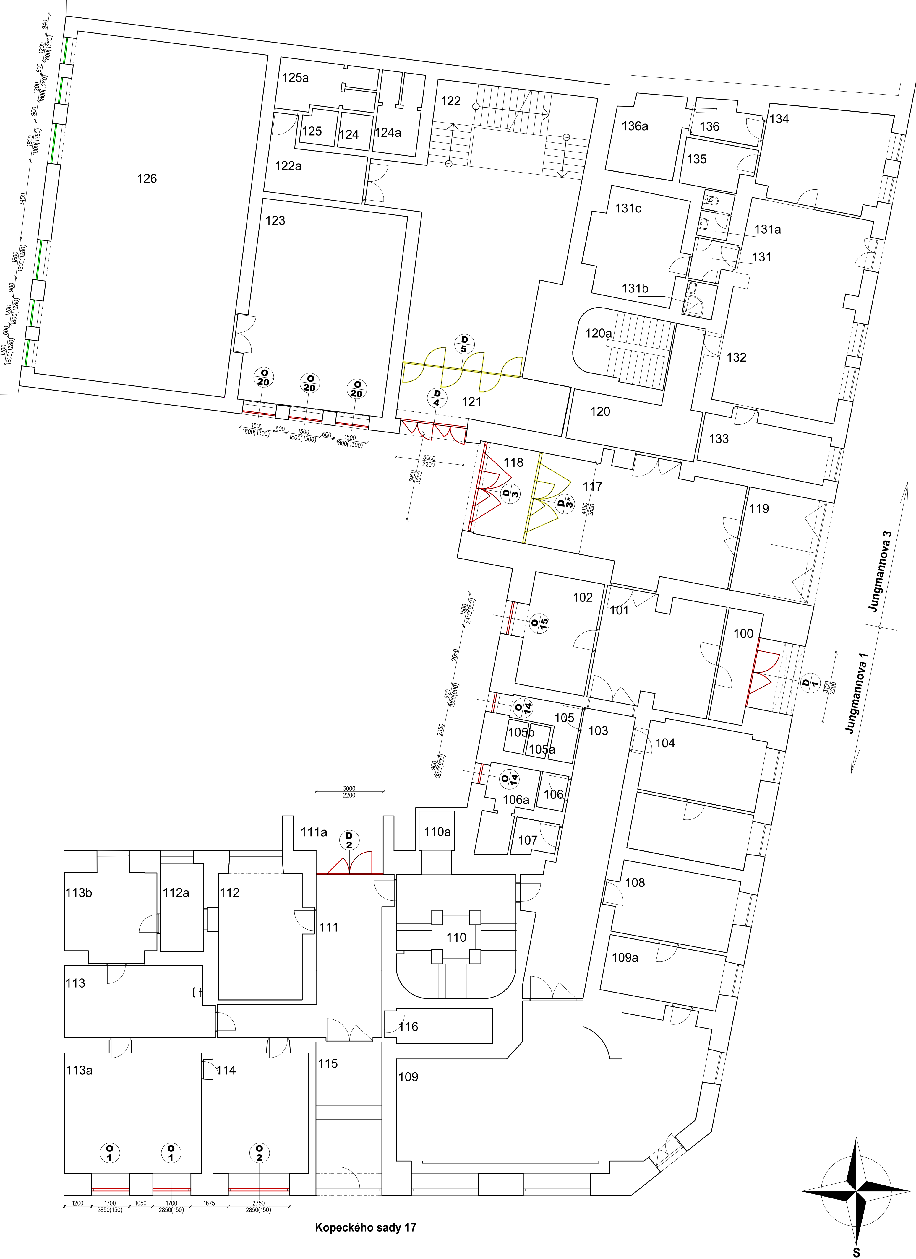
Kopeckého sady 17